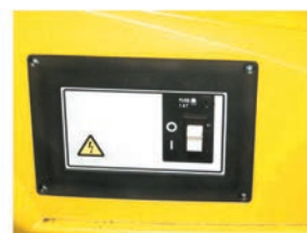
Включение одной кнопкой